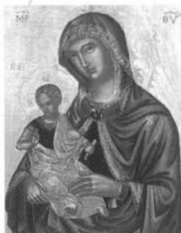
L'icona raffigurante la Beata Vergine col Bambino Gesù

Dopo una serie di necessari lavori di restauro, progettati e sapientemente diretti dall'arch. ing. Sergio Bombini, giovedì 1 febbraio c.a., Sua Ecc. Rev.ma Mons. Giovan Battista Pichierri, Arcivescovo di Trani-Barletta-Bisceglie e Nazareth, ha dedicato la cappella alla Vergine Maria Regina degli Apostoli, la cui invocazione, sorta solamente nel XX secolo, è inserita nelle Litanie Lauretane. Come osservanza liturgica è celebrata il sabato successivo alla festività dell'Ascensione.