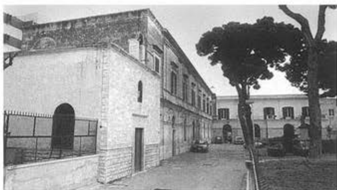
Chiesetta S. Maria degli Apostoli e Seminario

Dal punto di vista tecnico, è stata eliminata l'infiltrazione d'acqua piovana delle coperture voltate a botte, mediante la posa di un nuovo massetto con sovrastante impermeabilizzazione con guaina bituminosa e pavimentazione con lastre di pietra di Trani