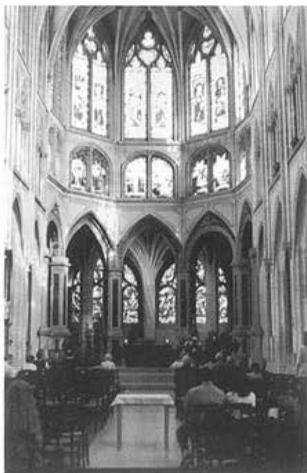
La chiesa di Saint Severin a Parigi

Ai poveri servi inutili della liturgia il compito di lavorare nel silenzio, certi che quanto da loro seminato, prima o poi, produrrà frutti abbondanti.