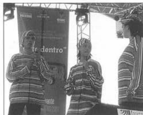
All'iniziativa barese erano presenti anche i giovani A.C.I. della Parrocchia S. Benedetto in Barletta, che hanno presentato il recital "Liberi Liberi"