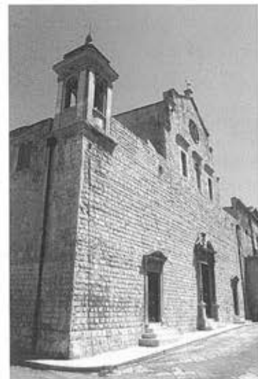
Barletta, Chiesa di Sant'Antonio