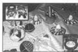
"La Solitaria" pro A55