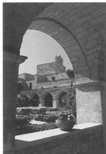
Il monastero di Colonna, sede della succursale del Conservatorio

Occorre infatti domandarsi quale sia il ruolo dei Conservatori oggi poiché in Italia la carriera musicale sovente è fatta più di dolori che di gioie e il Conservatorio è il luogo dove, purtroppo, non sempre si impara la musica come si deve.