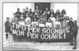
Scuola In... festa