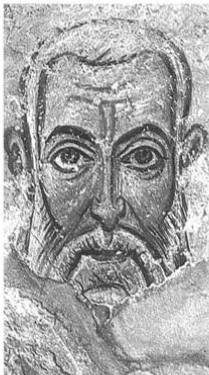
S. Andrea Apostolo