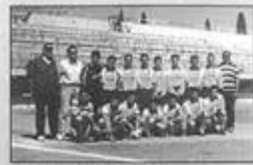
Giochi Sportivi Studenteschi - Calcio