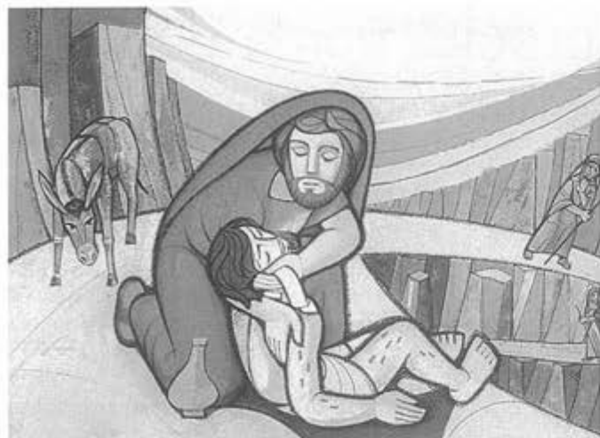
Raffigurazione della "parabola del buon samaritano"

questo non solo in nome di una solidarietà umana, senz'altro apprezzabile, ma che rimaneva lontana dal nostro spirito cristiano.