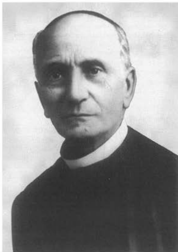
Il Beato Padre Annibale di Francia