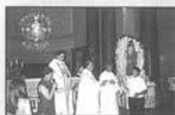
Gabinetto degli Studenti