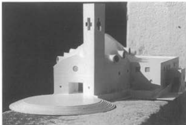
Chiesa di Sant'Andrea apostolo

Usando le parole dell'Arcivescovo, la parrocchia di Sant'Andrea è stata