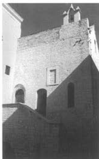
Trani, chiesa di Santa Maria Nova o Scolanova. La chiesa in origine era sinagoga.

Giovanni Paolo II nella celebre visita alla sinagoga di Roma (13.04.1986) è arrivato ad affermare con chiarezza: "L'Ebraismo non è estraneo a noi, ma in un certo modo è intrinseco alla nostra stessa religione... Siete i nostri fratelli prediletti e, si potrebbe dire, i nostri fratelli maggiori". Anche con l'aiuto del Catechismo della Chiesa cattolica (1992) e dei successivi rapporti di dialogo e di studio comune, il tutto tende a educare i cattolici a una migliore conoscenza e a un maggiore rispetto della tradizione ebraica in sintonia con la svolta radicale del Concilio che attende ancora di essere valorizzato