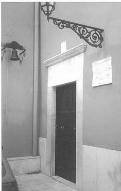
Chiesetta di S. Andrea